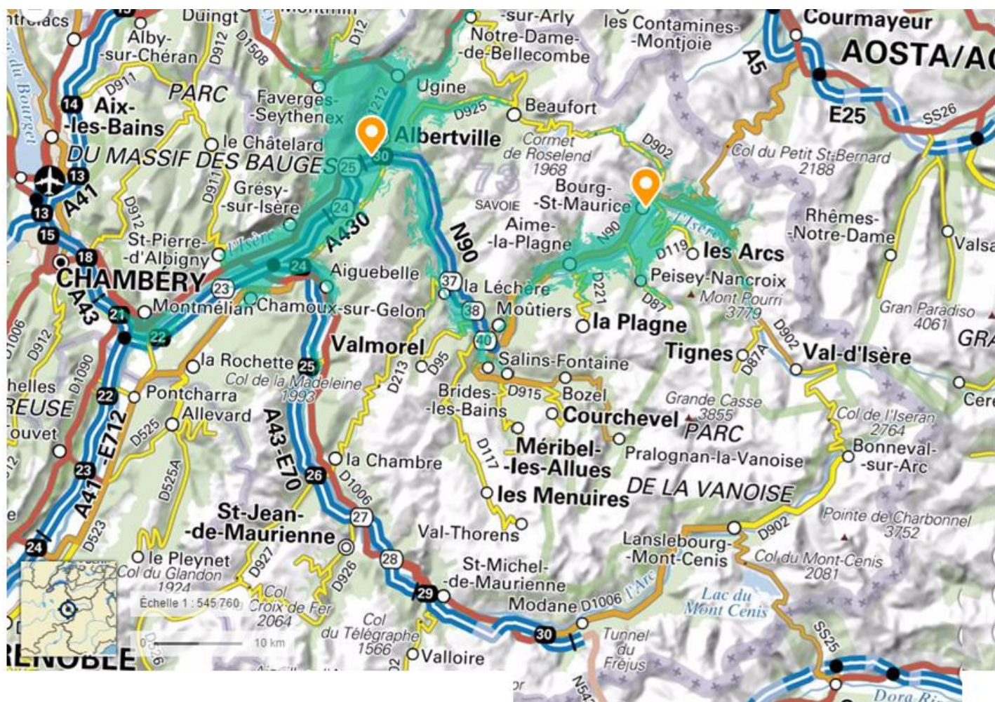
isochrones 30mn depuis Albertville et Bourg-St-Maurice